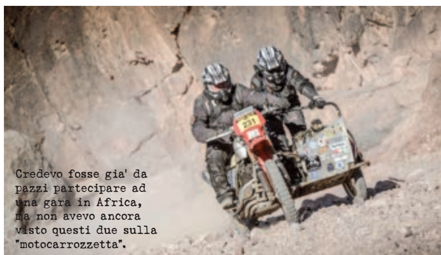
Credevo fosse già da pazzi partecipare ad una gara in Africa, ma non avevo ancora visto questi due sulla "motocarozzetta".