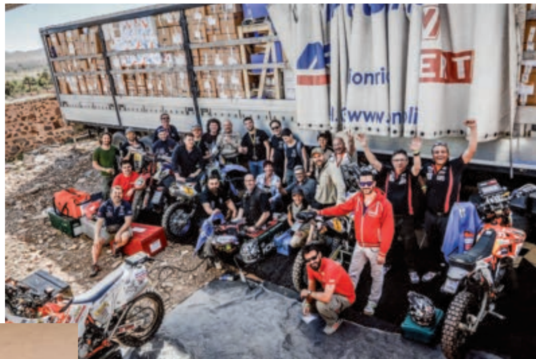
Sotto: Il team piloti Energia & Sorrisi al completo, con il bilico carico di aiuti umanitari.