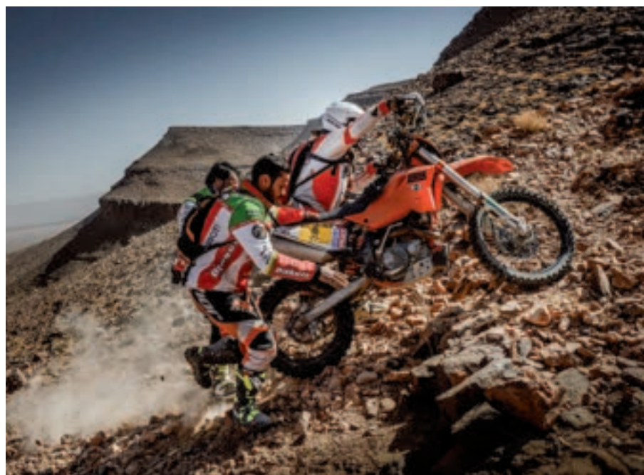
A destra: un passaggio ostico in stile enduro tra le pietre dove le moto più pesanti hanno avuto un bel da fare.