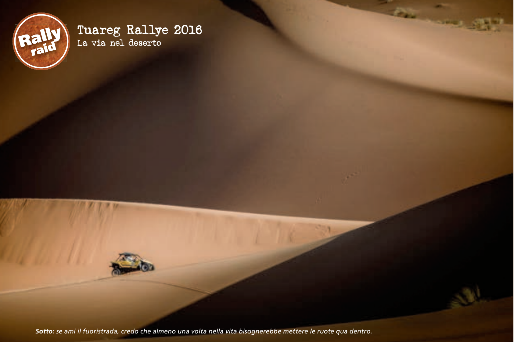
Sotto: se ami il fuoristrada, credo che almeno una volta nella vita bisognerebbe mettere le ruote qua dentro.